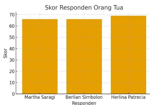
Gambar 1. Hasil Penilaian Responden Orang Tua terhadap Program Berenang

Hasil penelitian disajikan dalam bentuk data yang telah diolah dan diinterpretasikan berdasarkan skor angket evaluasi program berenang di TK Siloam. Data disajikan dalam tabel dan diagram untuk memberikan gambaran statistik yang jelas mengenai persepsi responden.